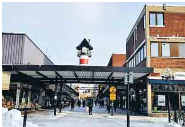
Oxelösund har fått en ny fyr, mitt i centrum.

SN på måndag: Han vill stoppa utarmningen av den kommunala skolan.